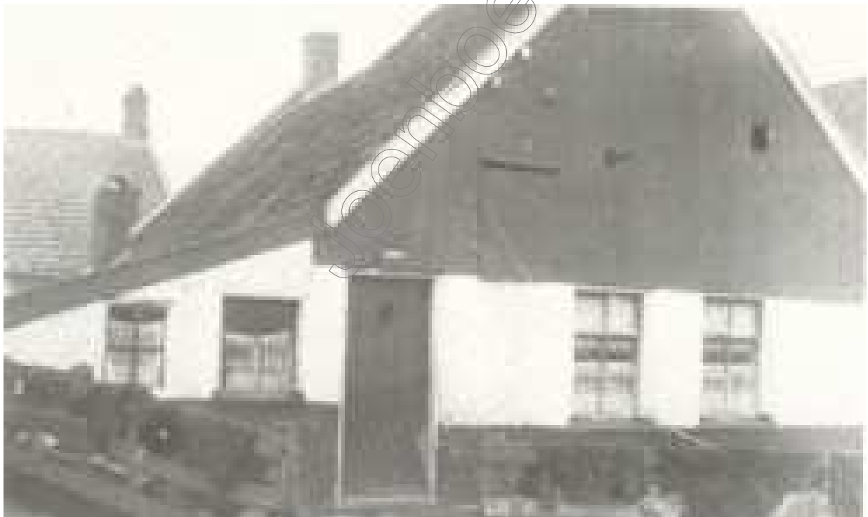
Het huis waar de eerste afgescheidenen bijeen kwamen.

Hier rust hij, die een reeks van 26 jaren Gods Kerke heeft gediend door 't Woord ons te verklaren. Hij was een brandend licht, 't welk in de dienst verteerde, totdat hij in den schoot der aarde wederkeerde.'